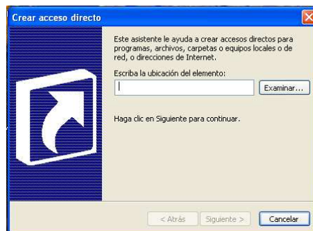
Figura 2. Petición de la ubicación del nuevo acceso directo

A continuación, Windows nos pedirá la ubicación del elemento (ver figura 2), y el nombre que aparecerá en nuestro icono de acceso directo.